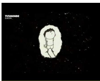
«МОЙ БРАТИК С ЛУНЫ» мультфильм